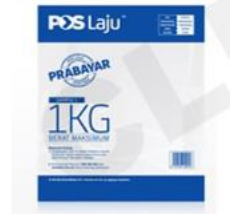
Contoh: Plastic Folder